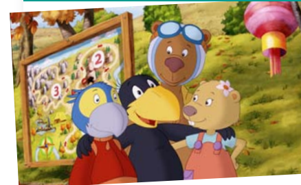
Der kleine Rabe Socke 2 - Das große Rennen

Dem kleinen Raben Socke passiert ein großes Missgeschick: Die mühsam gesammelte Ernte für den Winter wird vom Fluss weggespült, als Socke den Vorratsschuppen zum Einstürzen bringt. Doch leider ist kein Geld da, um neue Vorräte zu kaufen... FSK 0