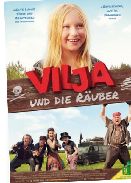
Vilja und die Räuber

* (Zuzahlung bei 3D-Projektion, Lounge und Überlänge. Familie = Mindestens ein Elternteil mit eigenem Kind.)